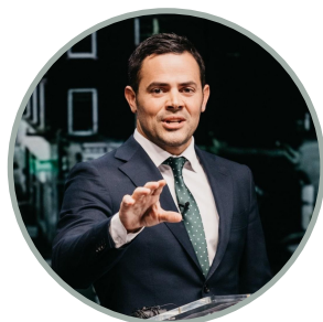
Weston Wamp Alcalde del Condado de Hamilton

45,000 estudiantes, desde Soddy-Daisy hasta East Lake, dependen de nosotros para proporcionar edificios escolares que les permitan crecer y prosperar desde el aula hasta el campo deportivo. Seamos valientes para ellos.